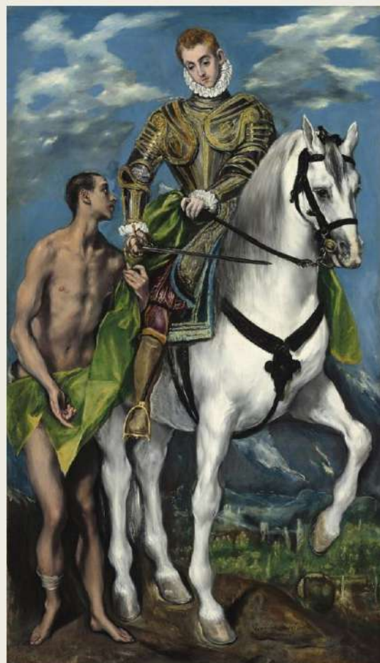
San Martino di Tour - Dipinto di El Greco (Candia, 1541 - Toledo, 7 aprile 1614)