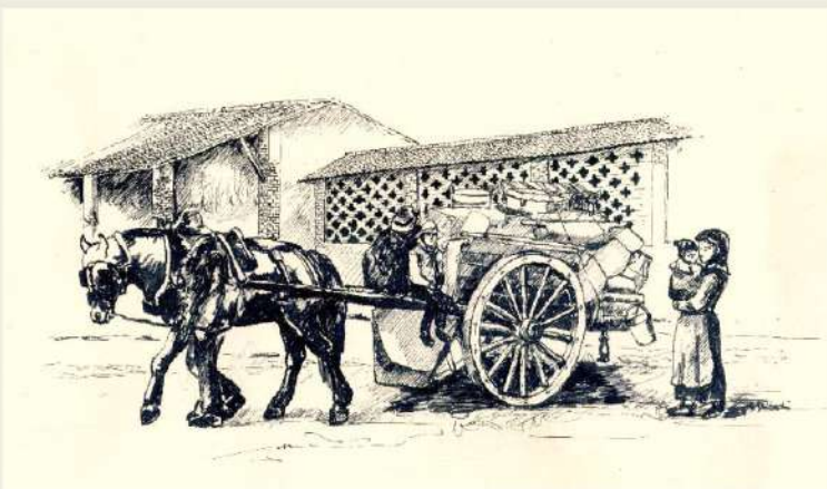
I Comuni aggregati a Milano nel 1923 ed il triste trasloco di una Famiglia Contadina a fine contratto, nel giorno di San Martino (disegno di Angelo Bianchi)

Autobus 67 (M1 - Bande Nere), 63 (M1 - Bisceglie), 78 (M1 - Bisceglie e M5 - San Siro), 49 (M1 - Inganni e M5 - San Siro)