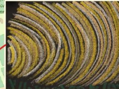
Mostra didattica dedicata a William G. Congdon