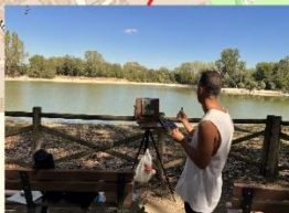
Ortinparco : estemporanea di pittura con laboratori a cura di Banca del Tempo