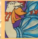
Caselle del Gioco dell'Oca e murale di Gattonero (Torretta cabina elettrica e Muri dell'ex mensa)