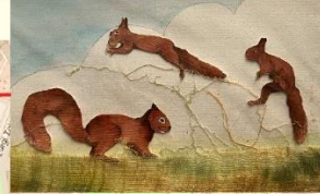
Scoiattolini e altri lavori di Daniela Dente